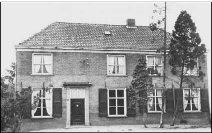
6. Het vroegere gemeentehuis van Hummelo en Keppel, 1930