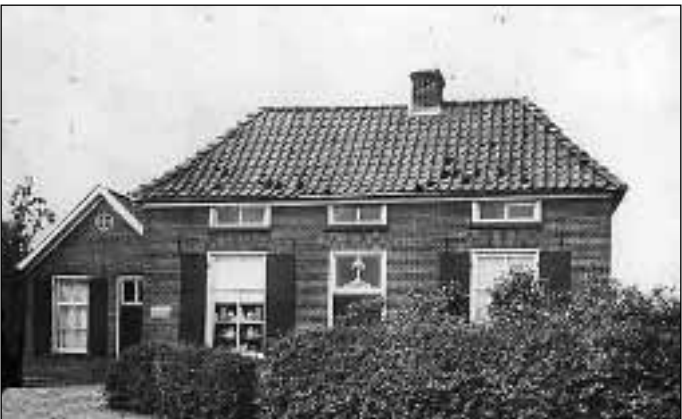
11. Op de plek van de garage stond vroeger de openbare school 12. Doetinchemseweg 47 in 1870 boerderij/bakkerij en winkel