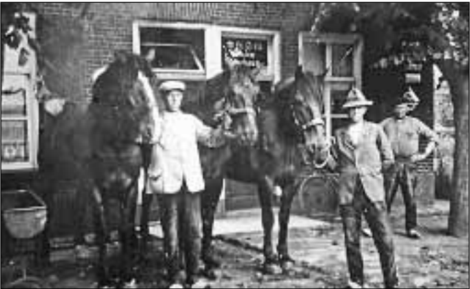
5. Van oorsprong dorpsboerderij met ijsverkoop 6. Plantsoenstraat 10, Café Kets