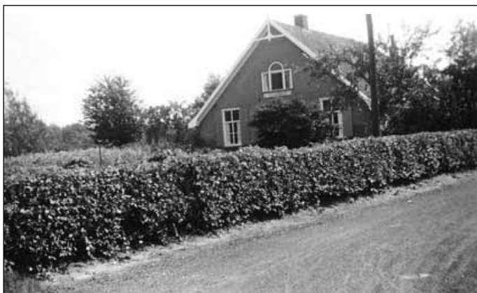
11. De zuivelfabriek in Hoog-Keppel omstreeks 1915