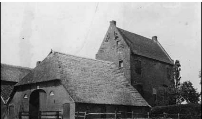
13. Kasteel Hackfort omstreeks 1920