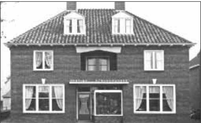
7. Bakkerij met bakkerswinkel, Plantsoenstraat 2 8. De schoenmakerij met winkel, omstreeks 1955