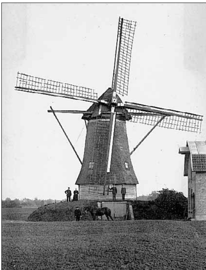
9. De eerste Willibrorduskerk in Achter-Drempt, 1925 10. De windkorenmolen in Achter-Drempt omstreeks 1910