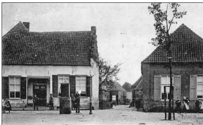
5. De Bovenstraat omstreeks 1910