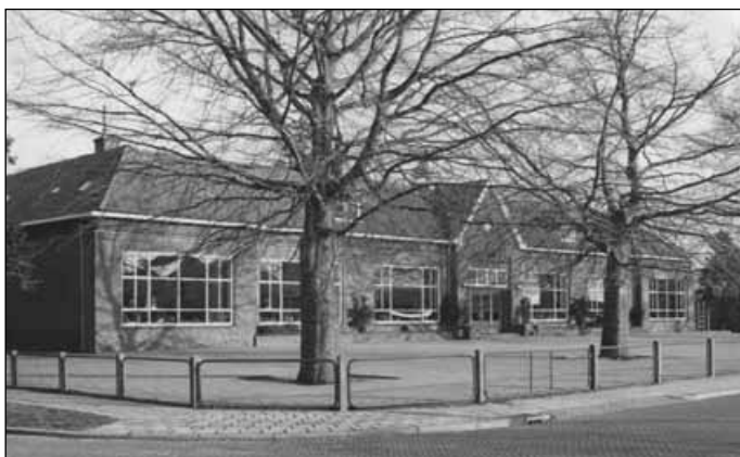
11. Links het pand Het Hoge 5 voor de restauratie