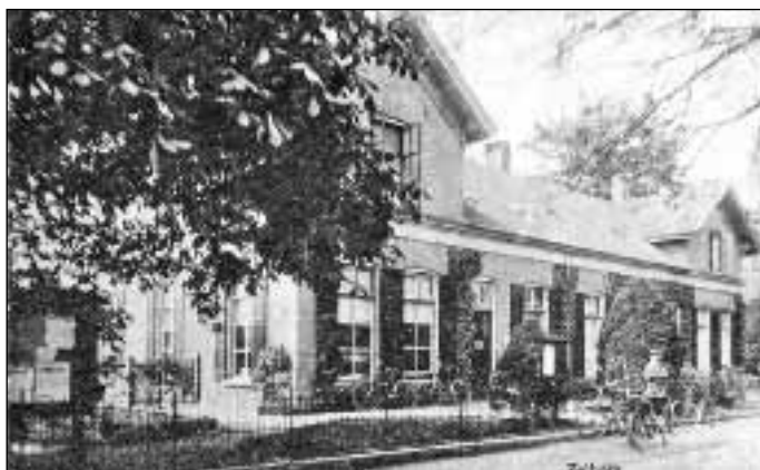
3. Stationsgebouw van de G.O.L.S.