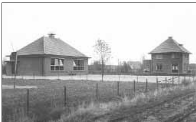
19. Boerderij/herberg "Quatre Bras" omstreeks 1920