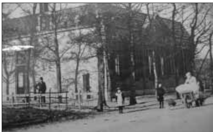
21. Kruisbergseweg 34-36, Velswijk, lagere school uit 1905