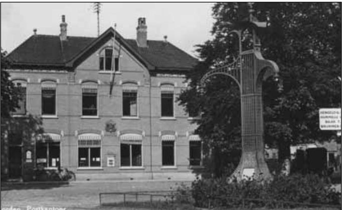
9. De Nieuwstad in Vorden omstreeks 1930 10. Het voormalige postkantoor aan de Nieuwstad, circa 1960