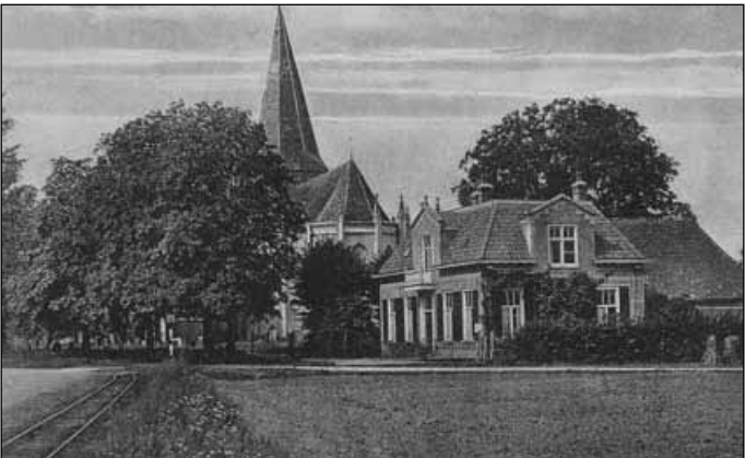
7. Het statige huis op de Van Panhuysbrink in 1920