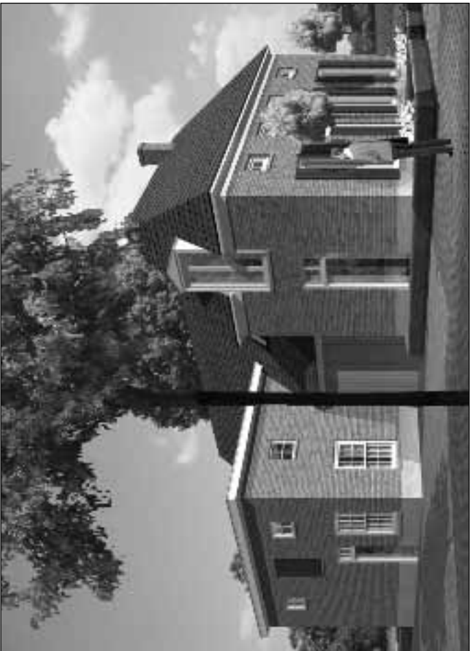
16. Twee voorbeelden van de verbouwing van het Boeyink-complex in meerdere wooneenheden, ontwikkelt door architect Vincenth Schreurs in samenwerking met WZH+.