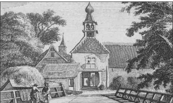
9. De Boterstraat in de jaren vijftig van de vorige eeuw 10. Het poortgebouw van het kasteel van binnen uit, 1743