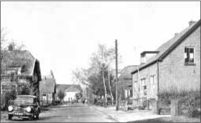
9. Smidsstraat 22-24, het in 1934 gebouwde postkantoor 10. Doetinchemseweg 30, in 1925 gebouwd als winkel met twee woningen