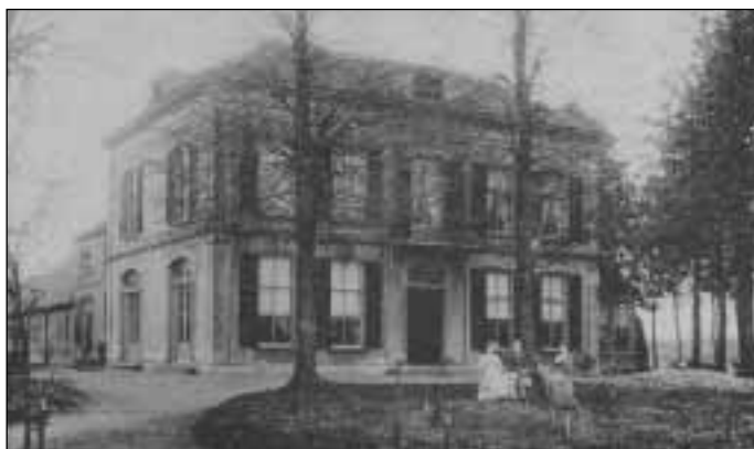
23. Stoomkorenmolen “De Volharding”, omstreeks 1920