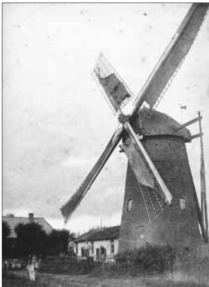
13. De molen van Boeyink, omstreeks 1900 (afgebroken 1910)