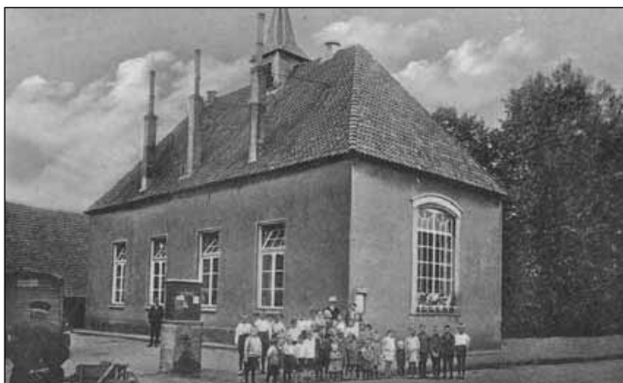
1. De kapel / het schooltje met stadspomp omstreeks 1900 2. De kapel / het schooltje met de schoolkinderen in 1910