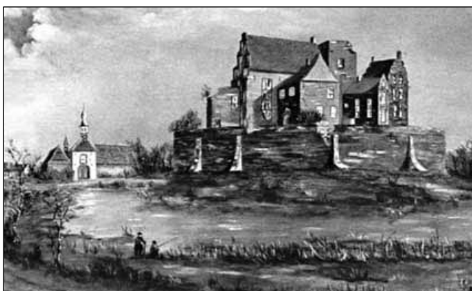
3. De ingang naar het kasteel met jachtopzienerswoning, 1910