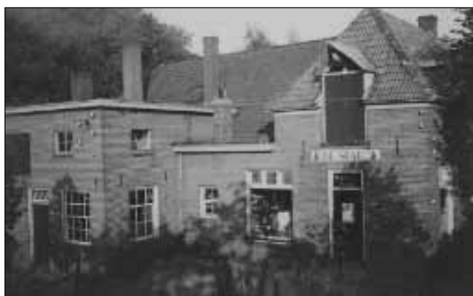
14. Boeyink, de kruidenierswinkel in 1930