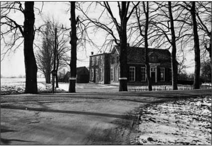
5. Boerderij Mulra omstreeks 1905