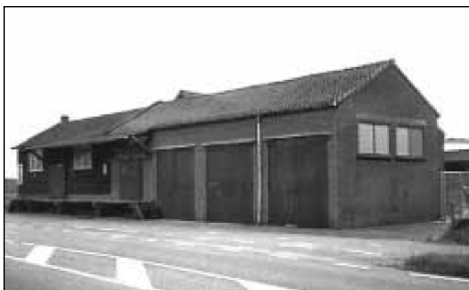
17. Het Zondagschoolgebouwtje aan de Garvelinkweg