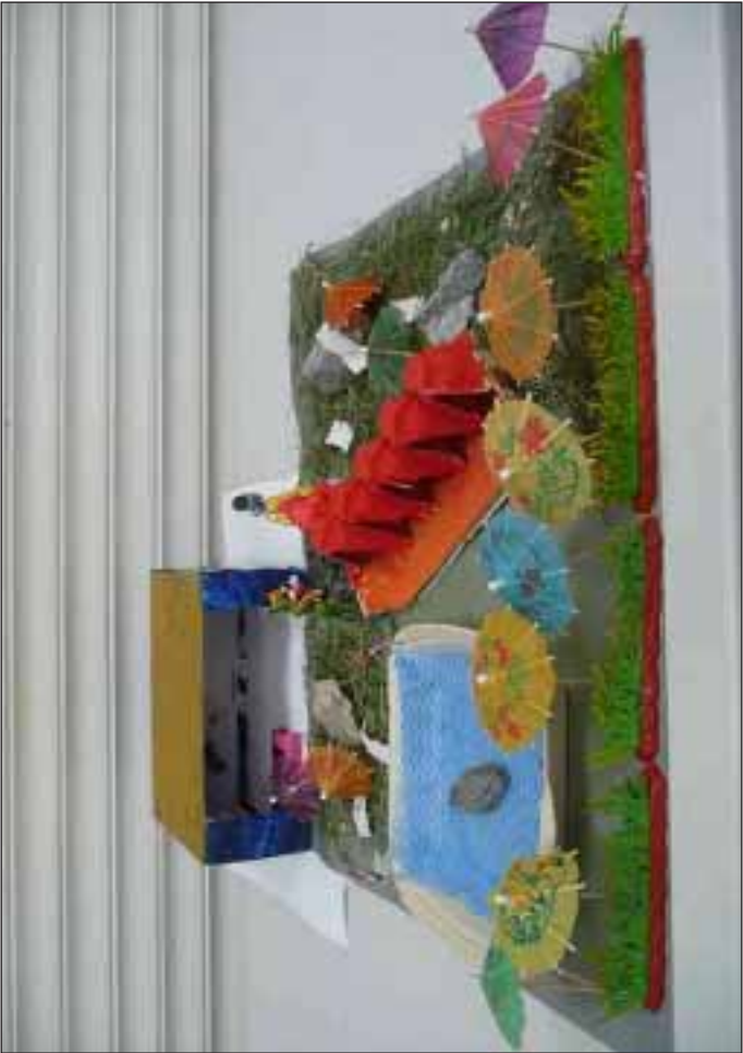
Twee van de ingestuurde werkstukken, boven van de Johanneschool te Steenderen, onder van de Meeneschool te Zelhem.