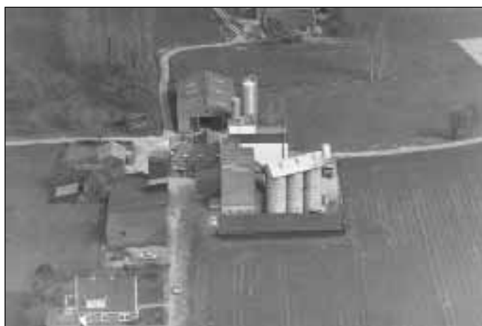
15. Boeyink-complex vanuit de lucht omstreeks 1998