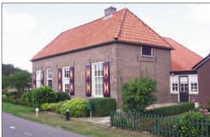
Boerderij Bautzen (1852) aan de Zelhemseweg

We komen weer op de Zelhemseweg bij boerderij de Beuten (nr. 19). We gaan nu eerst door tot nr. 29. Dit is boerderij BAUTZEN uit 1852. De naam herinnert aan de slag bij Bautzen aan de Spree in Saksen, waar Napoleon de verbonden troepen van Pruisen en Russen op 20 mei 1813 in een zware veldslag overwon.