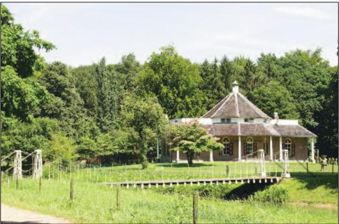
Het Jagershuis met een van de gerestaureerde bruggen