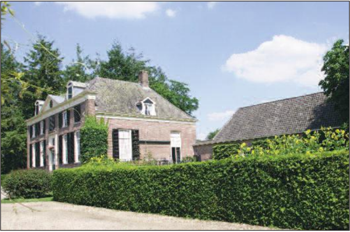
De rechter zijgevel van 't Zelle