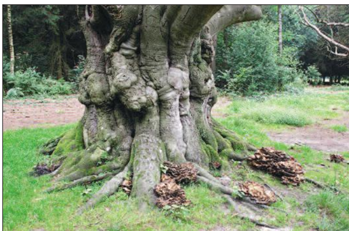
De toestand van de Rode Beuk kort voor de kap