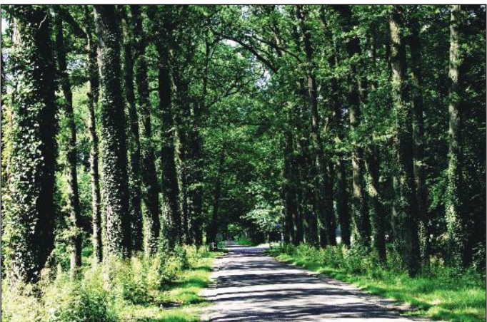
't Zelle staat bekend om zijn statige lanen