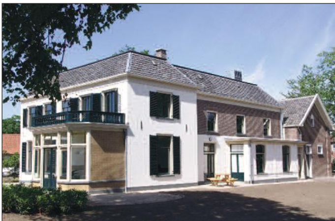
De zijgevel van de villa met rechts het aangebouwde koetshuis