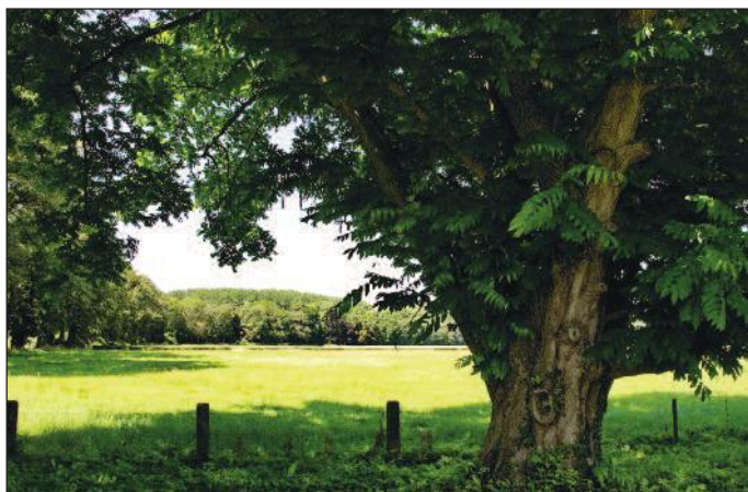
De Kaukasische vleugeloot, een van de bijzondere bomen op Enghuizen

Langs de sloten en beken op Enghuizen staan veelal knotwilgen. In het noordelijk gelegen deel van Enghuizen komen singels met elzenhakhout voor.