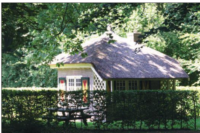
Het Grootvaders huisje uit 1920