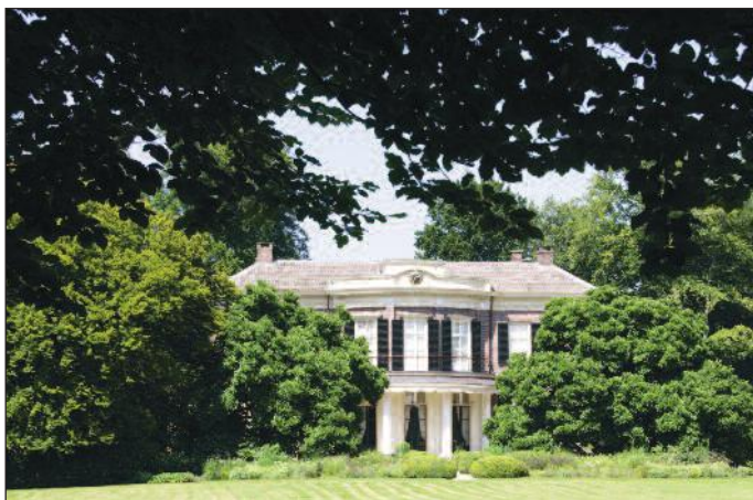
Het Enzerinck, centraal gelegen op het landgoed

Het Enzerinck is in de loop der eeuwen ontwikkeld van boerderij tot buitenplaats, waarbij terreingedeelten zijn aangelegd (of ingebruikgenomen) met verschillende vormen en stijlen, passend de voorkeuren van hun tijd. Naast agrarische gronden zijn dat ook siergedeelten waar een gedetailleerde en verzorgde aanleg werd nagestreefd volgens een bedachte compositie. Door vermindering van op de compositie gericht onderhoud zijn deze delen thans minder verzorgd en is een deel van de detaillering verloren gegaan. Veel van de in begin 20e eeuw aangebrachte sierbeplantingen zijn grotendeels verdwenen of onzichtbaar geworden. Door vervaging van de typerende ruimtelijke en visuele kenmerken van de diverse deelgebieden is de historische gelaagdheid van het terrein minder goed herkenbaar.