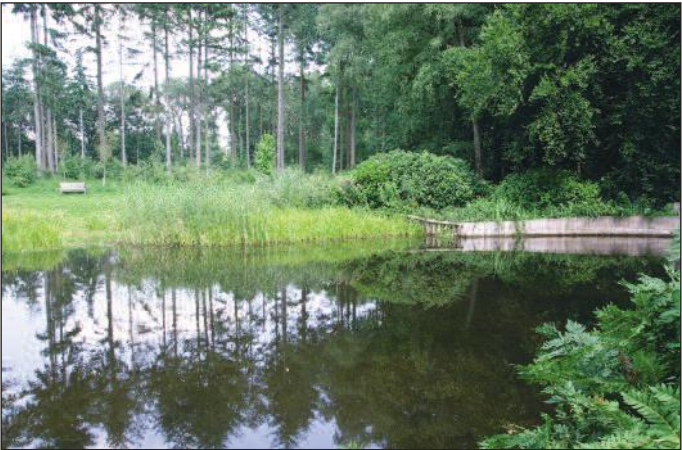
De binnenkort te restaureren zwembijver