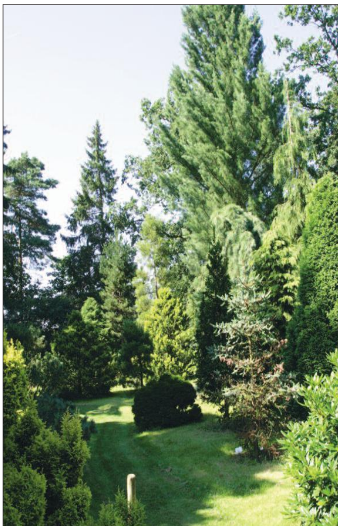
Een wandeling door het pinetum is niet alleen genieten van de fraaie coniferen maar ook van de vele vogels en insecten

Uw wandeling voert u langs een kleine duizend verschillende bomen. Exacte getallen zijn niet te geven omdat er ieder jaar toch wel zo'n 20 à 30 bomen verwijderd moeten worden (omdat zij of dood zijn gegaan of naar verwachting dood zullen gaan) terwijl er ieder jaar toch ook weer het nodige wordt bijgeplant.