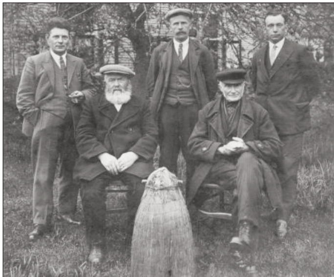
De "Bijenvereniging Hengelo" omstreeks 1933

”De Vooruitgang” beschikt over een eigen verenigingsstal aan de Dijenborgsestraat te Hengelo. Hier kunnen excursies worden gehouden, ook vinden er open dagen plaats. De leden kunnen verder gebruik maken van een honingslinger, een wassmelter, een refractometer en een microscoop.