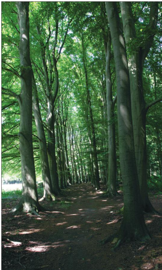
Een van de monumentale lanen van Het Enzerinck

Hiervoor gaat Natuurmonumenten diverse maatregelen uitvoeren, zoals: gerichte snoei en selectief verwijderen van opslag en ongewenste beplanting; herstel van divers gemengd inheems bos met afwisselingen, uitbaggeren van de vijvers; aanbrengen van accentbeplantingen op het eiland; herstel van de rozenberceau (overdekt pad of gang van rozen) en het vervangen van twee bruggen en banken.