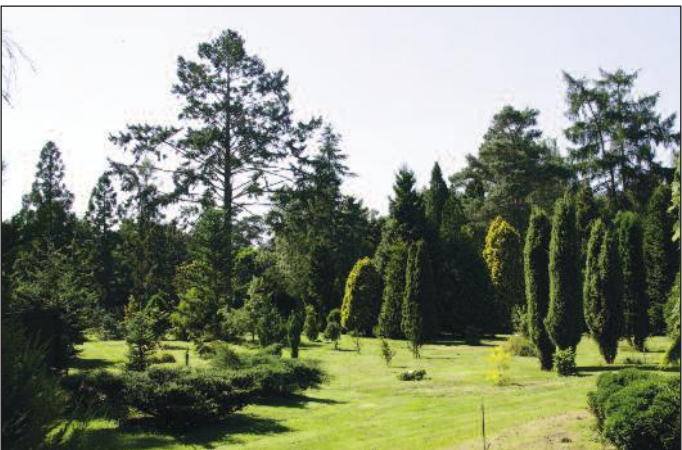
Een impressie van de unieke verzameling in het pinetum