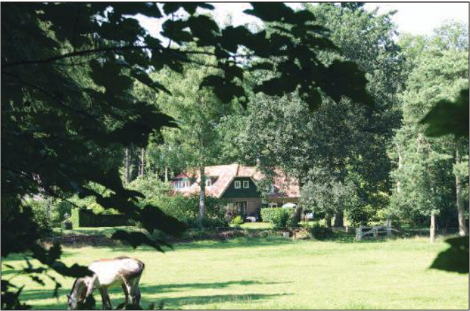
Het huis "De Belten", centraal gelegen op het landgoed

Binnen die zeven voornamelijk families treffen wij in totaal zo'n vijftig geslachten en vijfhonderd soorten aan, waarbij de etikette voorschrijft dat de geslachtsnaam met een hoofdletter begint en de soortnaam met een kleine (bijvoorbeeld: Abies pinsapo).