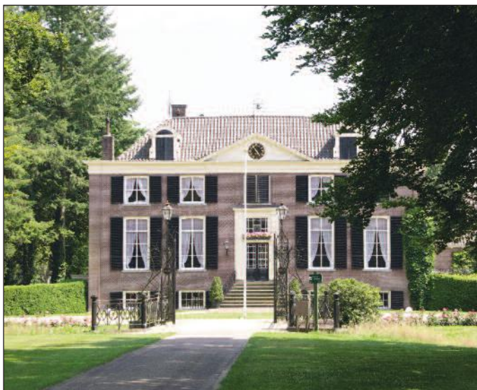
De fraaie voorgevel van 't Zelle

Het lanenstelsel is al zichtbaar op de oudst bekende kaart, de zgn. Hottingerkaart uit circa 1785. In het parkbos, dat deels is aangelegd op rabatten, is een uit de romantische tijd daterende vijver aanwezig, die door een slingerlaantje wordt verbonden met een waterdoolhof. In 2009 is door de Stichting tot behoud van Particuliere Historische Buitenplaatsen (Stichting PHB) een beheerplan opgesteld voor het cultuurhistorische hart van het Zelle, waarbij een uitgebreide studie is gedaan naar de historie ervan. Op basis van dit beheerplan zijn inmiddels verschillende elementen ervan opgeknapt en gerestaureerd, met name de zwemvijver, het slingerlaantje en de waterdoolhof.