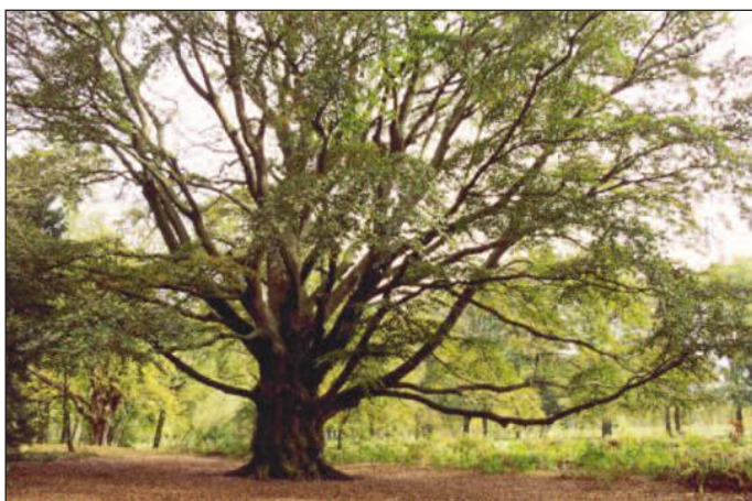
Een oudere opname van de Rode Beuk van Den Bramel

Maar ook andere bomen in het park spreken zeer tot de verbeelding. Zo kunnen we onder meer genieten van de Mammoetboom ( Sequoiadendron giganteum ) en de Gewone plataan ( Platanus × hispanica ).