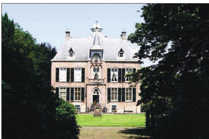
Het vooraanzicht van Den Bramel