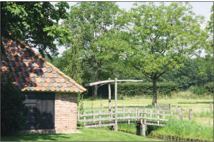
De ophaalbrug over de gracht achter 't Zelle