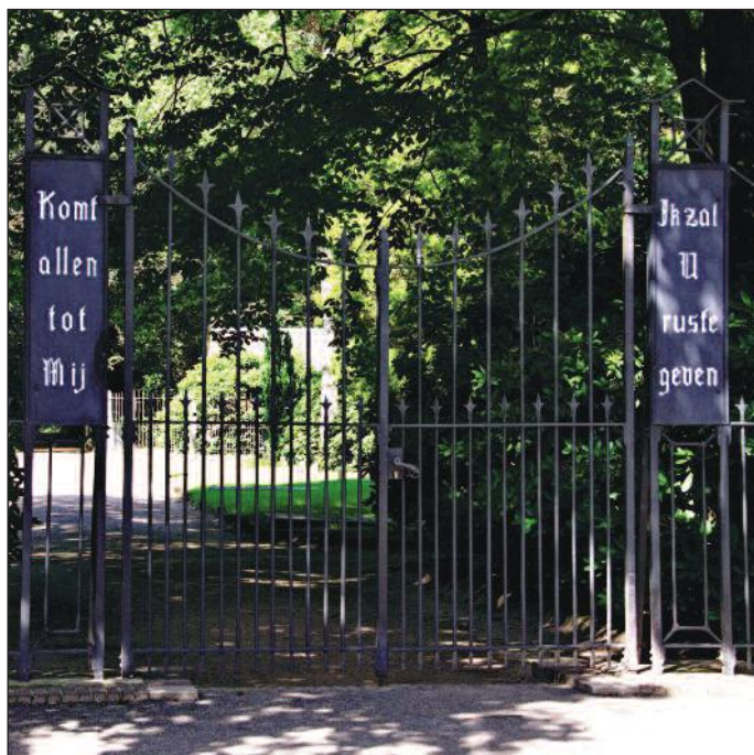
De smeedijzeren toegangspoort tot de begraafplaats

Op het laatst aangelegde 5e gedeelte worden vanaf 1989 graven uitgegeven, in totaal 535. Grenzend aan het dit deel heeft in 2008 een uitbreiding plaatsgevonden met 400 graven, voldoende capaciteit tot het jaar 2020. De aanleg van dit gedeelte past in de context van de omgeving en de begraafplaats zelf. Het is glooiend aangelegd met slingerende paden, de aanplant bestaat uit bosplantsoen, voornamelijk jonge eiken, maar ook heesters en taxus. Het nieuwe gedeelte heeft een parkachtige uitstraling.