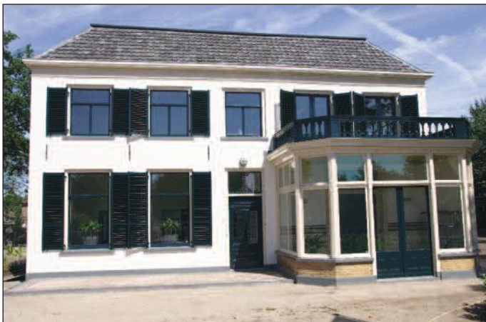
De voorgevel van de onlangs gerestaureerde voormalige notariswoning met erker

Aan het tuinontwerp is uiteraard ook veel aandacht besteed. Er is sprake van een parkachtige aanleg met enkele zichtlijnen naar het gebouw. Over enige tijd zal het nu nog jonge park ongetwijfeld weer haar oude allure terugkrijgen.