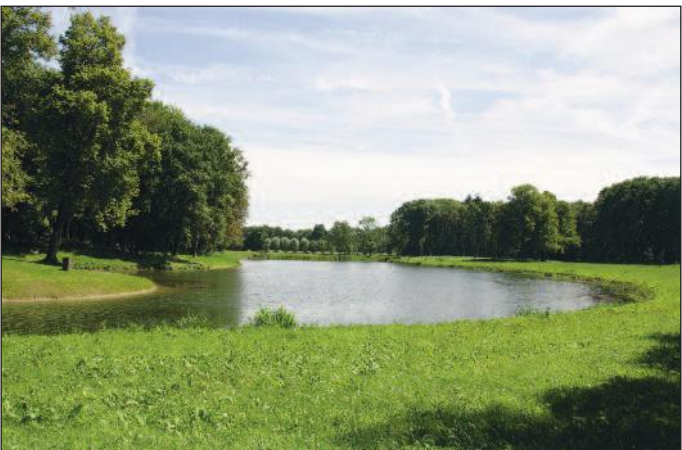
De fraaie vijver bij het Jagershuis