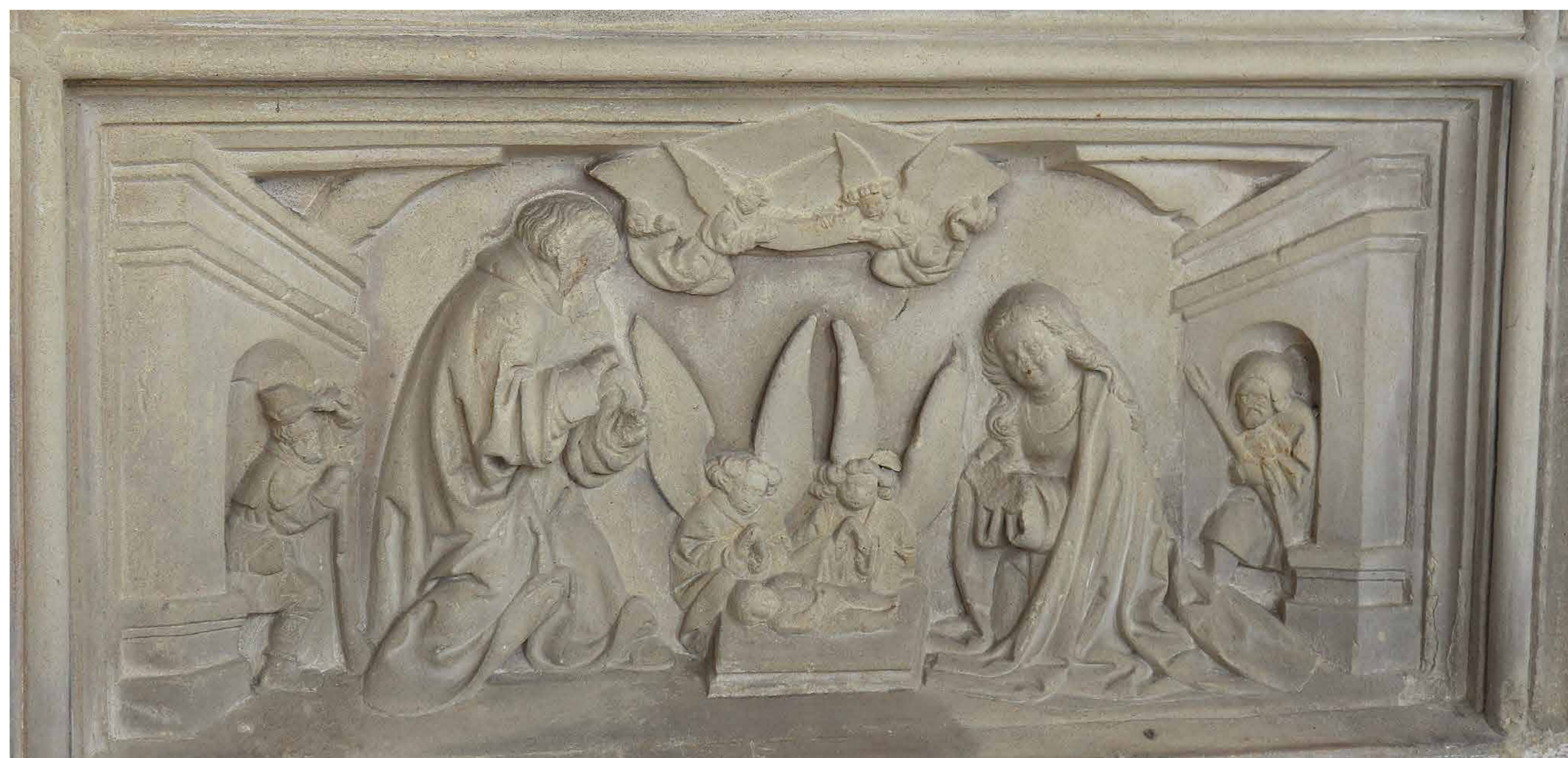
Een bijzondere steen met een reliëfvoorstelling van de aanbedding van het Kind door Maria, Jozef, Engelen en een herder, gemaakt in de 16de eeuw

Zo kunnen we nu genieten van de afbeeldingen van vijf heiligen, bladeren en bloemen, een uil, een ekster en twee zwaluwen, die door onbekende kunstenaars 500 jaar geleden zijn gemaakt.