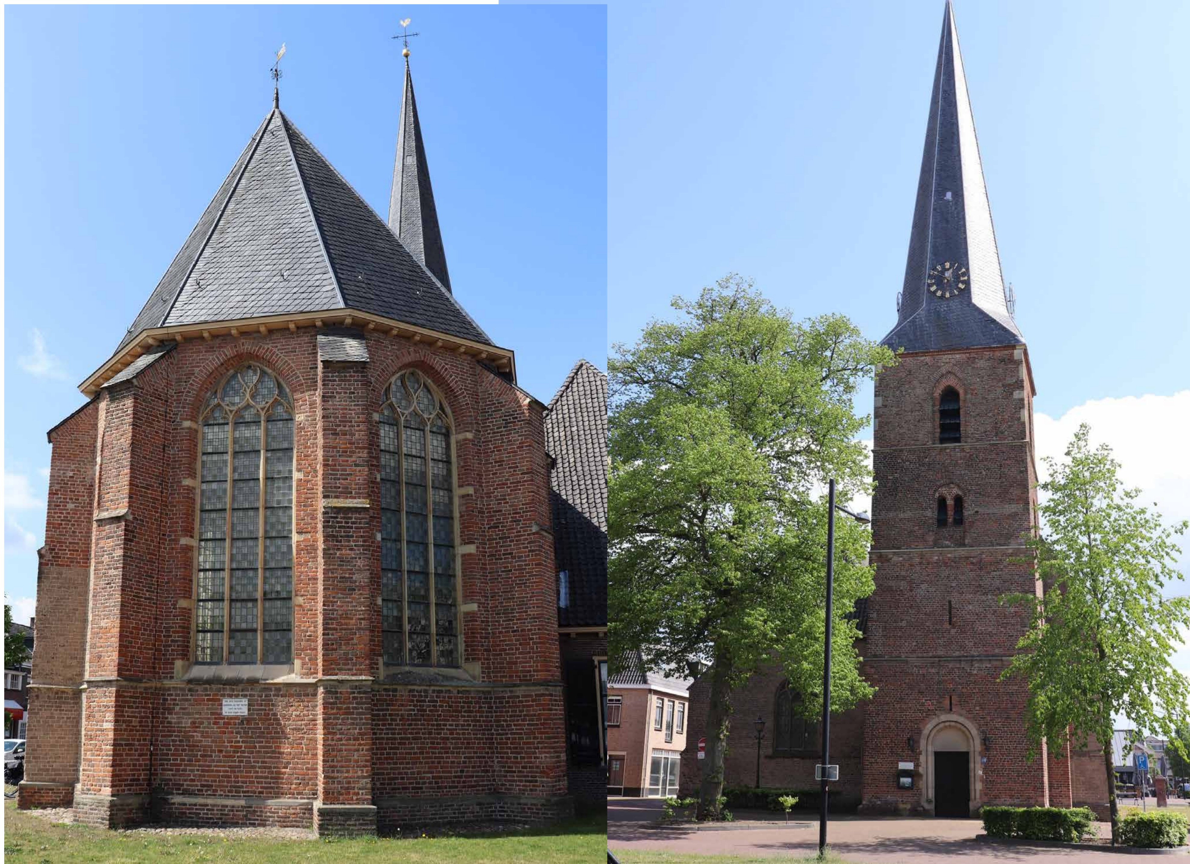
Vorden Kerkstraat 2 Dorpskerk of Antoniuskerk

Op deze plaats, in het centrum van Vorden stond eeuwenlang een kerk. De eerste kerken waren van hout, maar al voor 1235 werd hier een kerk van steen gebouwd, in de romaanse stijl met halfronde bogen, nog te zien aan het ingangsportaal.