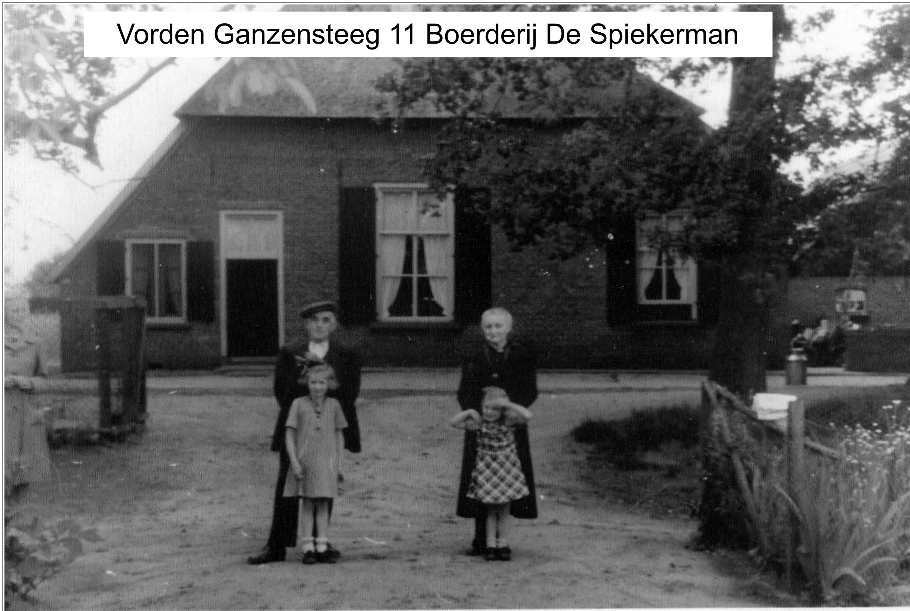
Vorden Ganzensteeg 11 Boerderij De Spiekerman