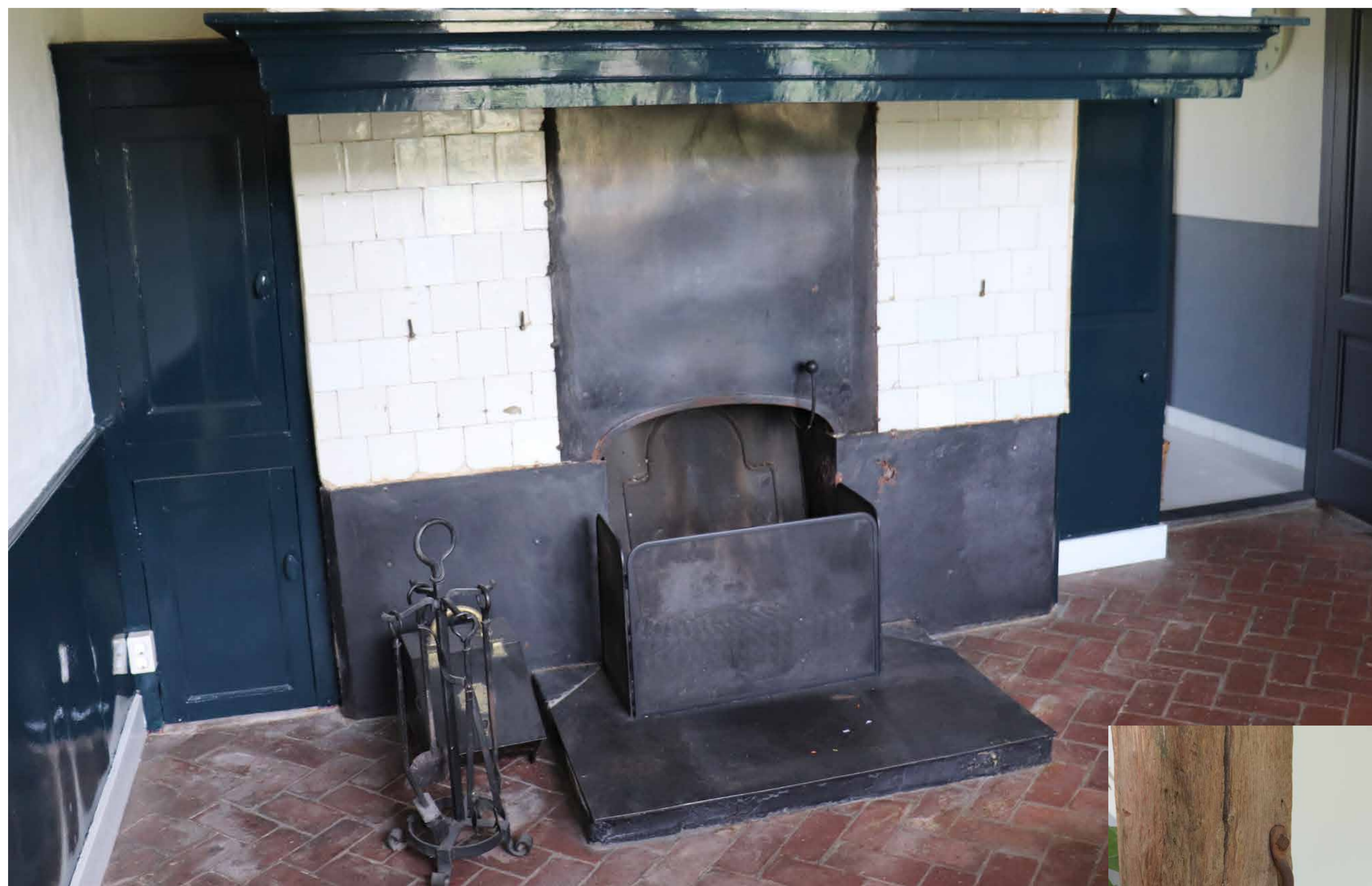
"Binnen waren veel elementen bewaard gebleven, zoals de mooie eikenhouten gebinten, de ringen waar de koeien vroeger aan vast stonden, oude muren en de schouw"

De boerderij staat ook bekend als Klein Bokslag omdat hij gebouwd is op de gronden van de oudere boerderij Bokslag, Ganzensteeg 9.